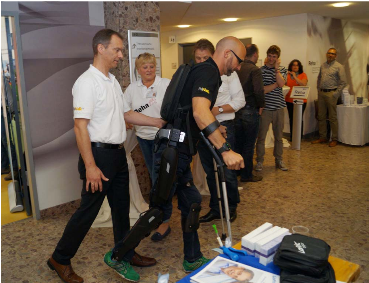
vom Symposium am 18. März